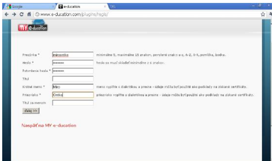
Obrázok č. 2 Druhé prihlasovacie okna

Keď sa Vám zobrazí úvodná stránka elektronického vzdelávania, musíte kliknúť na modrý odkaz Zaregistrovať sa.